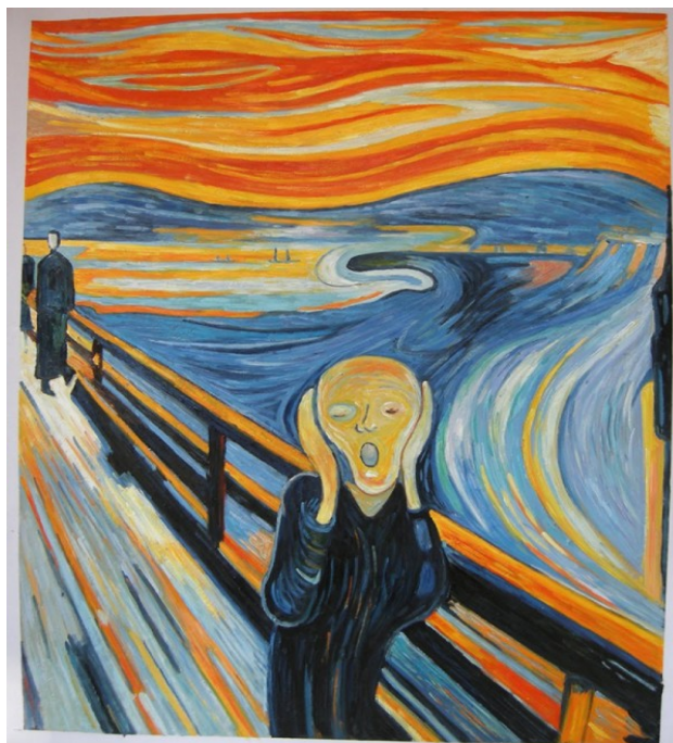
O grito. Edvard Munch (1893), Galeria Nacional, Oslo (Noruega)